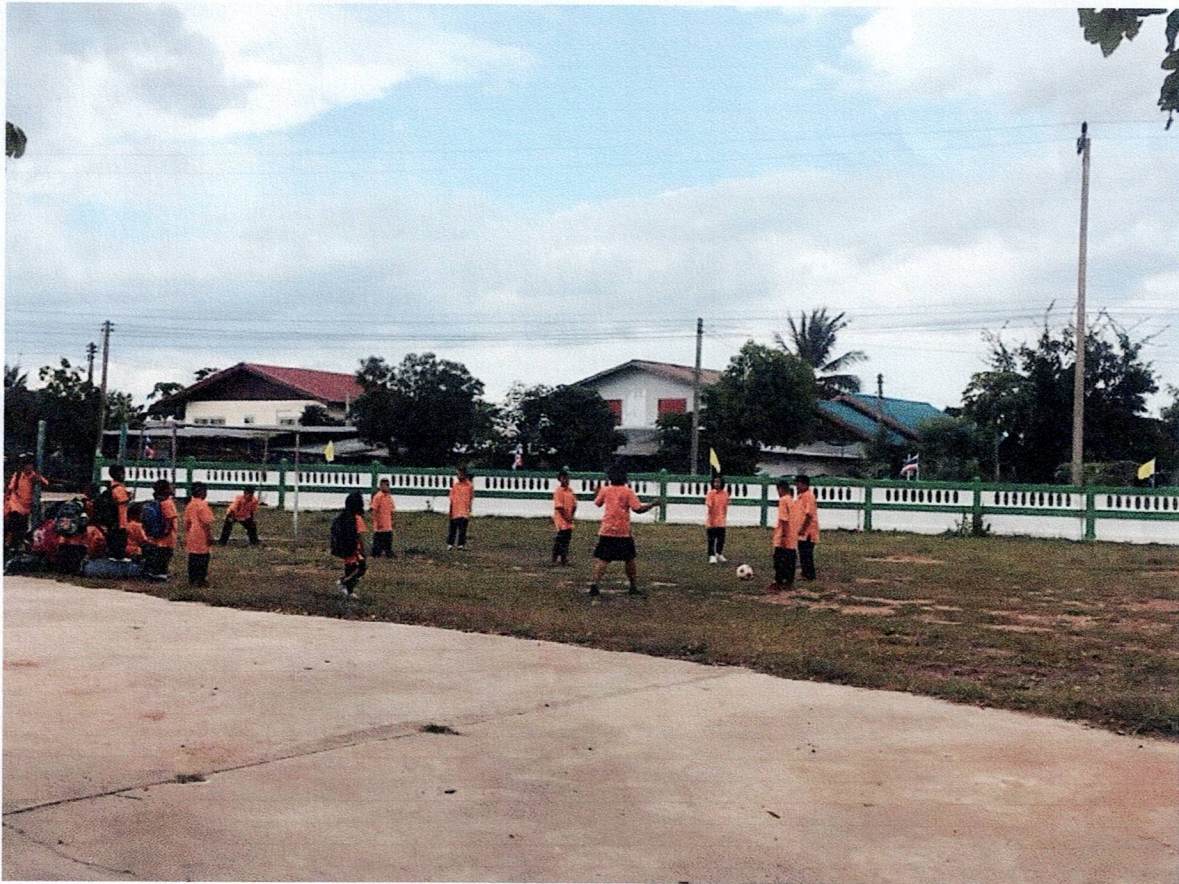
สนามกีฬาโรงเรียนบ้านตะหนด