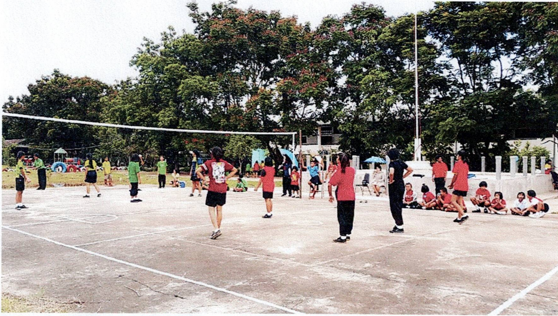
สนามกีฬาโรงเรียนปริยัติไพศาล

ลานกีฬา/สนามกีฬา เพื่อให้ประชาชนได้ใช้ในการแข่งขันกีฬาหรือออกกำลังกาย