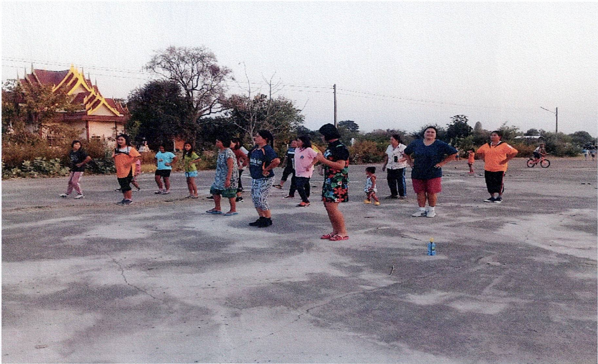
ลานกีฬา หมู่ที่ 2

ลานกีฬา/สนามกีฬา เพื่อให้ประชาชนได้ใช้ในการแข่งขันกีฬาหรือออกกำลังกาย