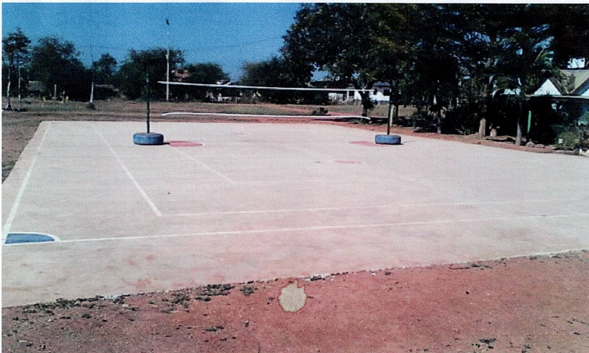
สนามกีฬาโรงเรียนบ้านมะค่า