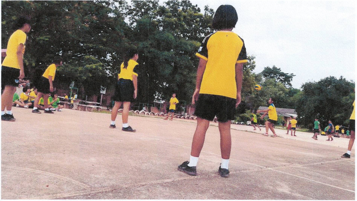
สนามกีฬาโรงเรียนบ้านขาม