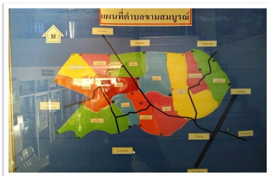
แผนที่องค์การบริหารส่วนตำบลขามสมบูรณ์